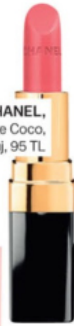
CHANEL, Rouge Coco, ruj, 95 TL