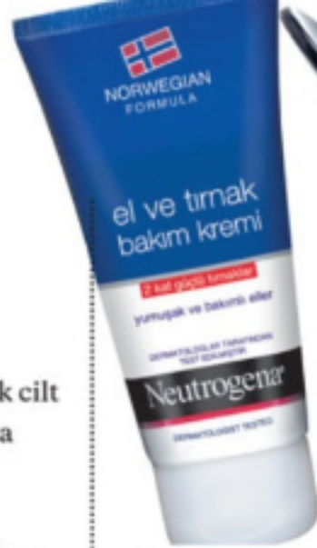
NEUTROGENA, el kremi, 13,50 TL

Cilt bakımınız için neler yapıyorsunuz? Düzenli olarak cilt bakımı yaptırır mısınız? Ya da evdeki rutininiz nasıldır? Cildim çok kuru olduğu için sürekli nemlendirmem gerekiyor. Haftada bir peeling yapıyorum. Her gece mutlaka yüzümü temizleyip, gece kremi sürüp öyle yatıyorum. Sabah da yine cildimi nemlendirerek güne başlıyorum. Bir de bol bol su içmek cilt için en güzeli sanırım. Doğal bakım reçeteleriniz var mı? Temizlik dışında yok açıkçası. Cildimi her zaman temiz ve nemli tutmaya özen gösteriyorum. Beğendiğiniz ve güzelliğine hayran olduğunuz ünlü isimler kimler? Kendine bakan, güvenen ve etrafına pozitif enerji yayan herkes.