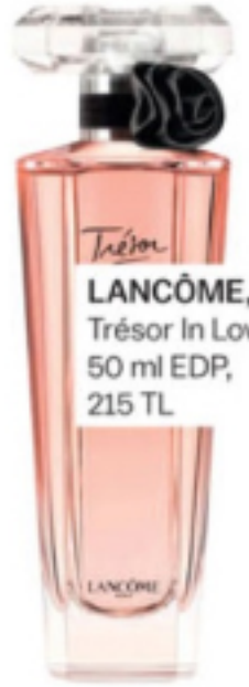
LANCÔME, Trésor In Love, 50 ml EDP, 215 TL