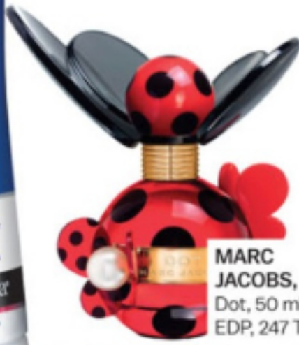
MARC JACOBS, Dot, 50 ml EDP, 247 TL